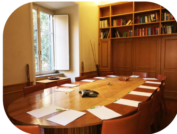
SALA GIULIO CESARE